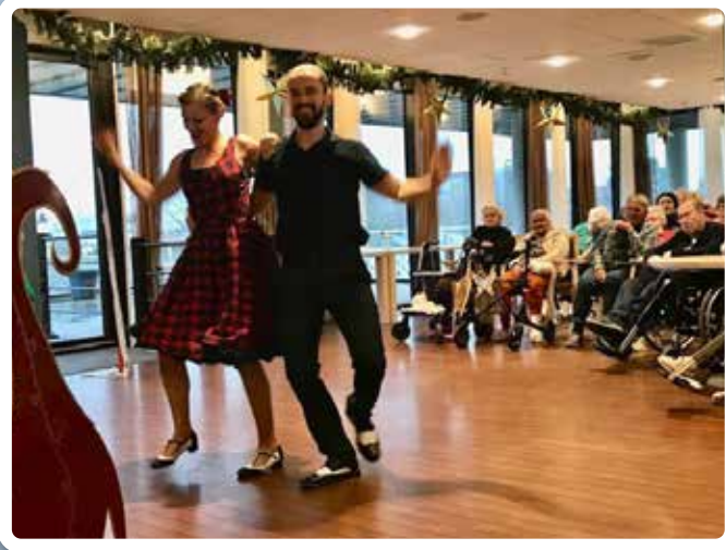
Optreden New Memories