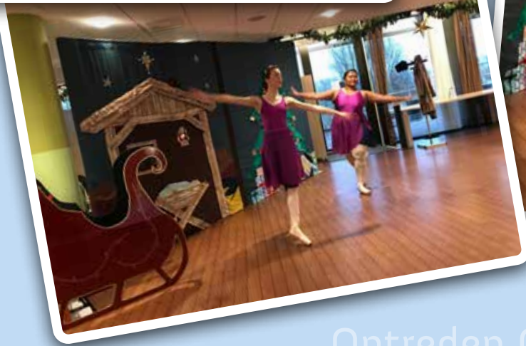
Optreden Charles Dickenskoor